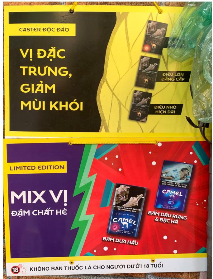
Biển quảng cáo thuốc lá bên ngoài một cửa hàng bán lẻ ở Hà Nội.

Một nghiên cứu quan sát ở khu vực thành thị và nông thôn của 10 thành phố tại Việt Nam (Thành phố Hồ Chí Minh, Hà Nội, Đà Nẵng, Hải Phòng, Cần Thơ, Hà Tĩnh, Cẩm Phả, Tây Ninh, Hòa Bình, Buôn Hồ) đánh giá việc tuân thủ pháp luật và giám sát việc bán thuốc lá điếu, thuốc lá điện tử và HTP. Từ tháng 12 năm 2021 đến tháng 1 năm 2022, tất cả các đại lý bán lẻ (n=1470) trong bán kính 100 mét tính từ trường học (n=371) hoặc bưu điện (n=325) đều được quan sát việc trưng bày sản phẩm, quảng cáo và quảng bá.