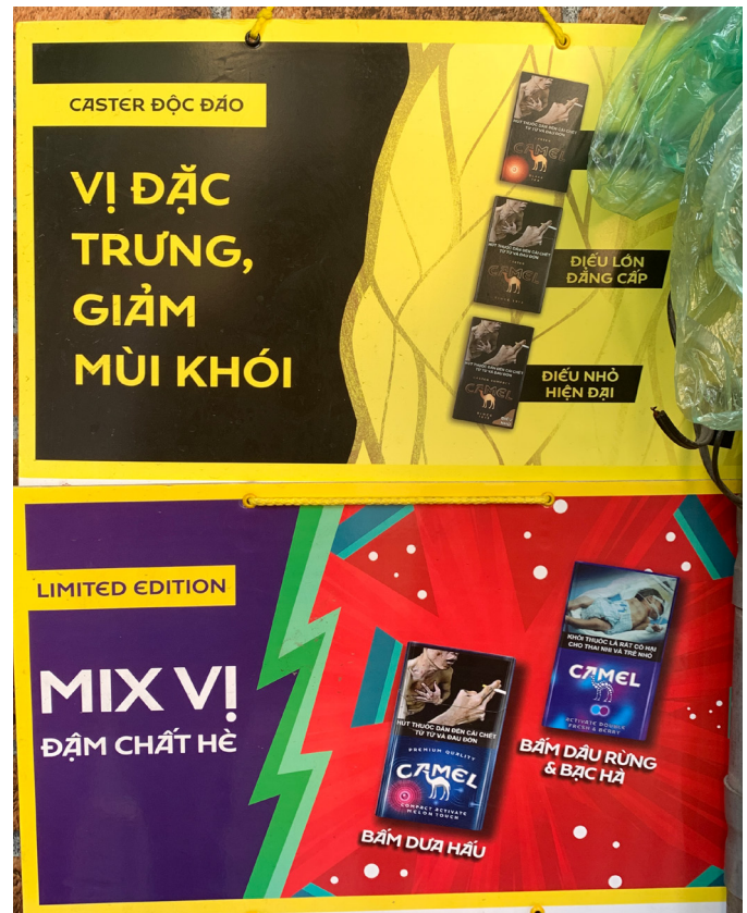
Biển quảng cáo thuốc lá bên ngoài một cửa hàng bán lẻ ở Hà Nội.

Một nghiên cứu quan sát ở khu vực thành thị và nông thôn tại 10 thành phố ở Việt Nam (Thành phố Hồ Chí Minh, Hà Nội, Đà Nẵng, Hải Phòng, Cần Thơ, Hà Tĩnh, Cẩm Phả, Tây Ninh, Hòa Bình, Buôn Hồ) đã được thực hiện để đánh giá việc tuân thủ pháp luật và giám sát việc bán và tiếp thị sản phẩm thuốc lá điếu. Từ tháng 12 năm 2021 đến tháng 1 năm 2022, đã tiến hành quan sát việc trưng bày, quảng cáo và quảng bá các sản phẩm thuốc lá ở tất cả các đại lý bán lẻ (n=1463) trong bán kính 100 mét tính từ trường học (n=371) hoặc bưu điện (n=325).